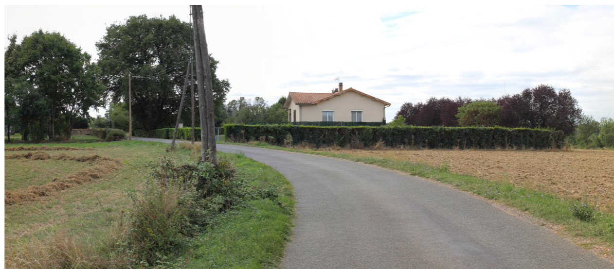
Photographie de l'état initial à 50°